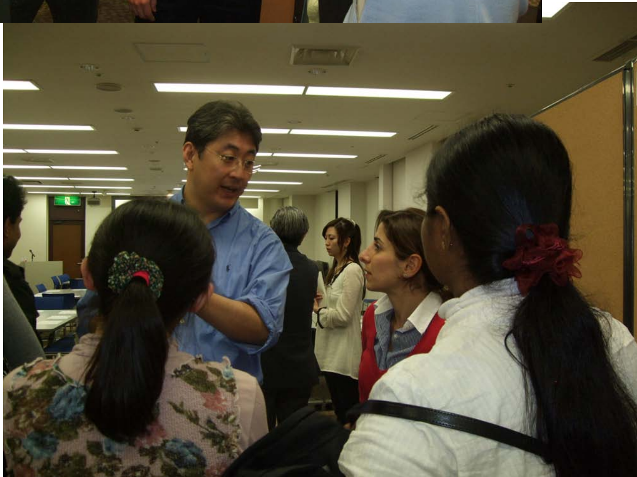
学生全員によるポスター発表とディスカッション